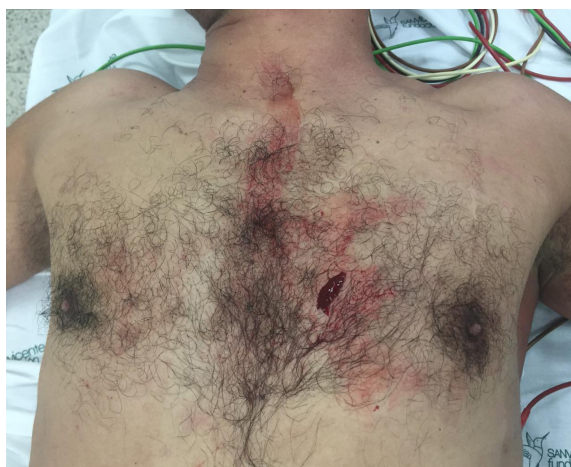
Figura 1. Herida penetrante en área precordial.

Ante esto se practicó ventana pericárdica, la cual fue positiva para hemopericardio de aproximadamente 150 ml; se evacuaron coágulos del saco pericárdico, se introdujo una sonda Nelaton