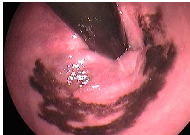
FIGURA 2. Colonoscopia en retrovisión, donde se aprecia la extensión a canal rectal de las lesiones de melanoma.

En el seguimiento, persistió libre de enfermedad hasta ocho años más tarde, cuando en una TC de control se observó un nódulo pulmonar en el lóbulo medio, hiper-